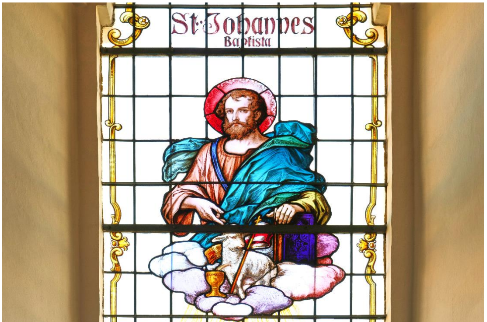
Johannes der Täufer - Fenster in der Pfarrkirche Leonberg

Sechs Monate vor Weihnachten, am 24. Juni , feiern wir das Hochfest der Geburt Johannes des Täufers . Es steht heute in Verbindung zur am 21. Juni stattfindenden Sommersonnenwende. Das heidnische Sonnwendfeuer wurde auf Jesus (Sonne - Symbol für Christus) umgedeutet nach den Worten des Täufers: „Er muss wachsen, ich aber kleiner werden“.